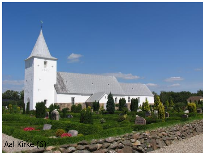
Aal Kirke (6)