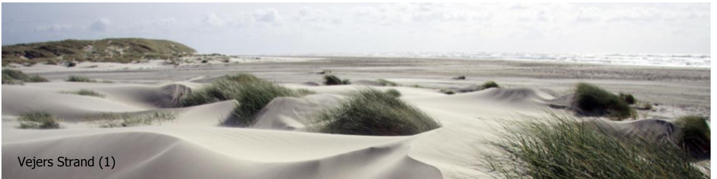
Vejers Strand (1)