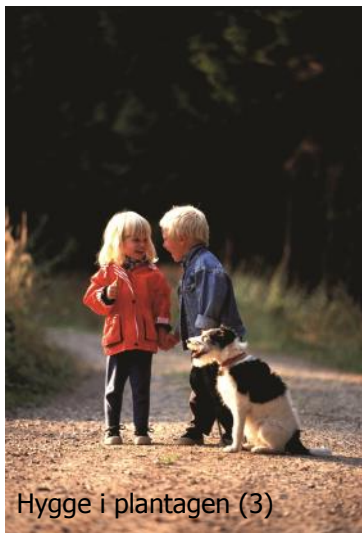
Hygge i plantagen (3)